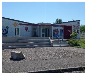
Le Jardin des Bouts D'Choux