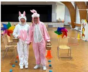
Chasse à l'oeuf