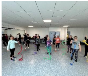
Atelier Siel Bleu